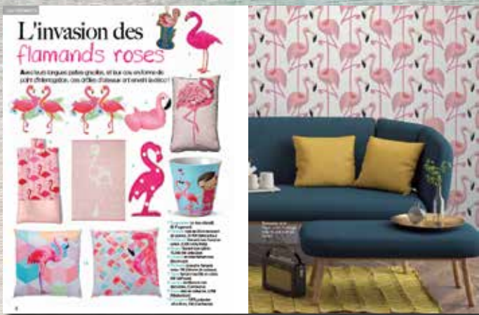
Les Tendances Shopping