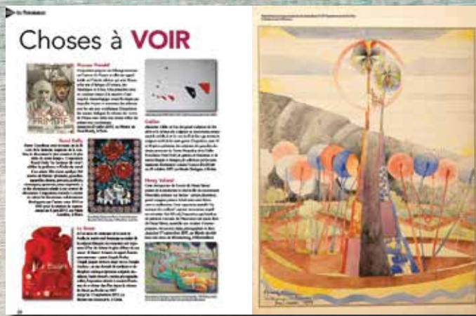
Les idées à la page/Les choses à voir